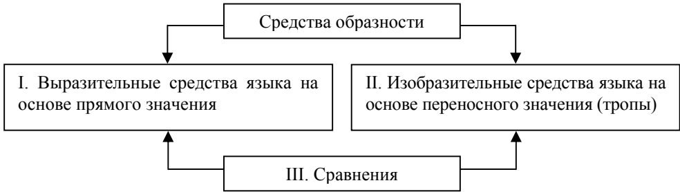
Рисунок 1. Схема деления средств образности Э.Ризель и Е.Шендельс

М.П.Брандес, беря во внимание технику создания тропов и фигур, называет их «фигурами замещения» и «фигурами совмещения» соответственно (рисунок 2). Фигуры замещения делятся на два типа: фигуры количества – приемы, выражающие сопоставление двух разнородных предметов (явлений) или их свойств с общим для них признаком, и фигуры качества – приемы опосредованной языковой образности (тропы).