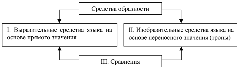
Рисунок 1. Схема деления средств образности Э.Ризель и Е.Шендельс

М.П.Брандес, беря во внимание технику создания тропов и фигур, называет их «фигурами замещения» и «фигурами совмещения» соответственно (рисунок 2). Фигуры замещения делятся на два типа: фигуры количества – приемы, выражающие сопоставление двух разнородных предметов (явлений) или их свойств с общим для них признаком, и фигуры качества – приемы опосредованной языковой образности (тропы).